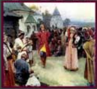
Лебедев. Народный танец.